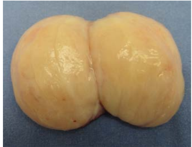
Figura 2: Pieza macroscópica de tumor de cúpula vaginal.